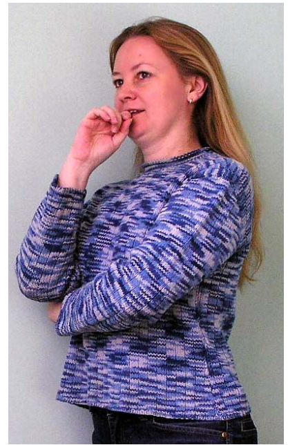
a) ↑ b) ↓